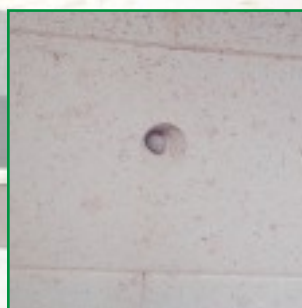
Thermoelement zur Temperaturerfassung, geschützt eingebaut