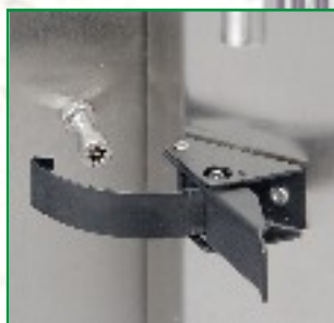
Justierbarer Schnellverschluss in Industrieausführung, abschließbar