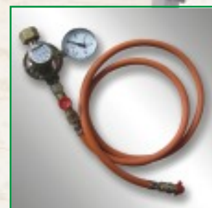
Druckregler mit Manometer (inkl. aller Armaturen zwischen Brenner und Gasversorgung), einfache und sichere Gastechnik nach DVGW