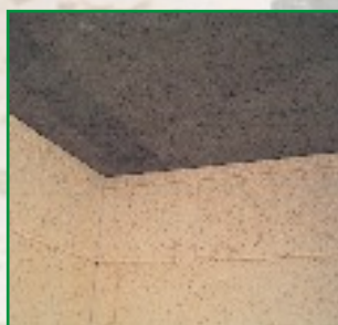
R-SIC-Deckenplatte, kein Befall