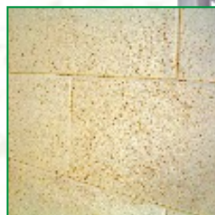
Brennraum mörtellos gefugt, keine Rissbildung