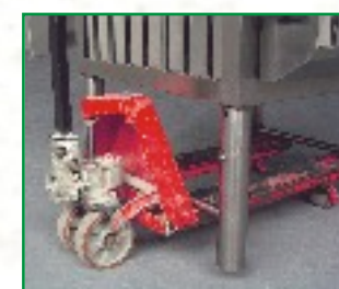
Untergestell mit Querstrebe für leichten Transport mittels Hubwagen